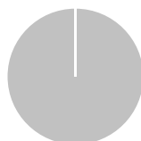
Alignement des investissements sur la taxinomie, hors obligations souveraines*

■ Alignés sur la taxinomie (0%) ■ Autres investissements (100%)